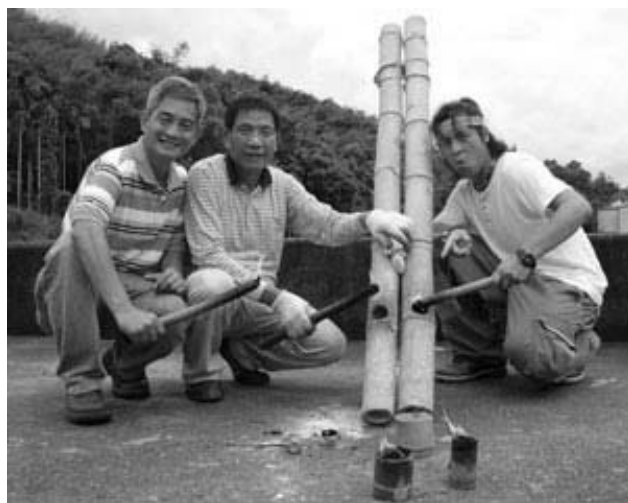
照片二：科學小原子第四集—阿美族的竹炮使用電土作火藥