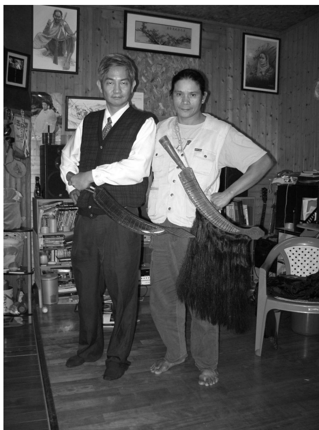
照片一：台灣原住民科學例—太魯閣族的刀下有人髮