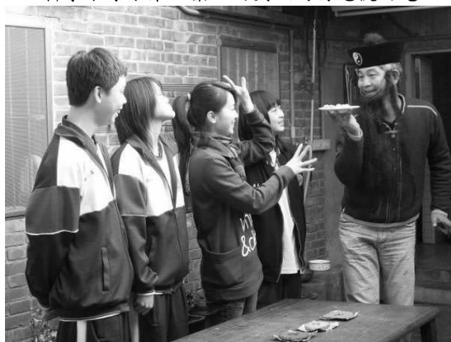
照片三：遊客家搞科學第 30 集—土礮(磨穀器)