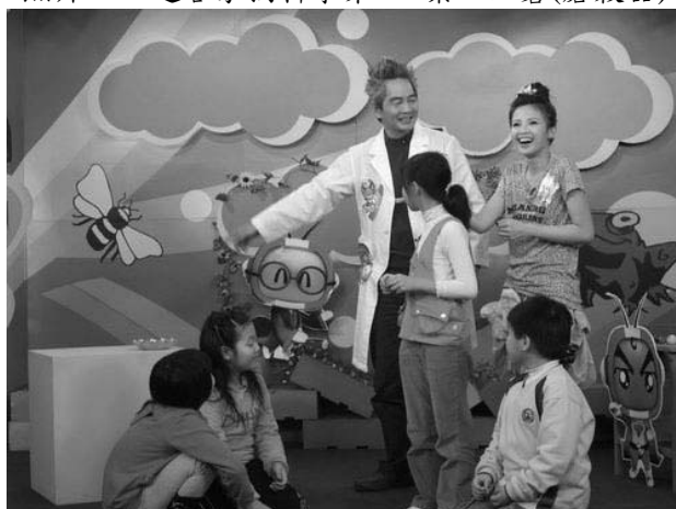
照片四：TV 課輔班第一集—童玩中的陀螺